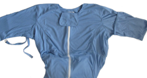
Pflegedecke mit Ärmel - S254BA301