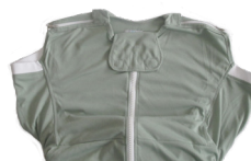
Pflegedecke für Kontrakturen - S254CA401