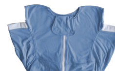
Pflegedecke ohne Ärmel - S254AA301